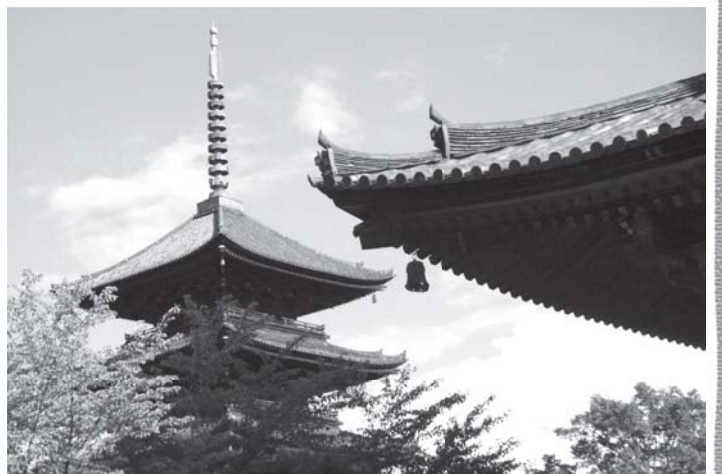
東寺 金堂から見る五重塔

空海が十年の歳月を費やして完成させた 講堂 の中には 立体曼荼羅 。日本一の高さを誇る 五十五メートルの五重塔 。国宝 大師