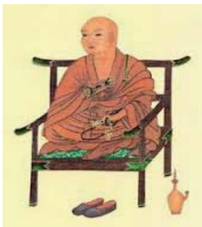
真言宗を興した空海

七歳違いの最澄と空海。それぞれ桓武天皇と嵯峨天皇を後ろ盾として、天台宗と真言宗を興した日本仏教の二大巨頭です。