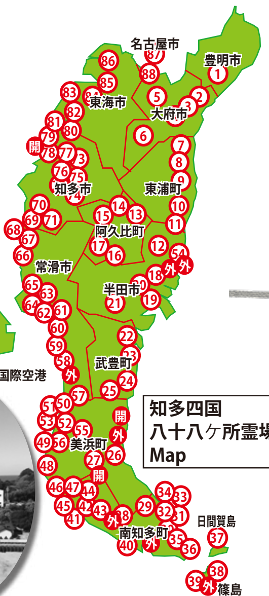
知多四国 八十八ヶ所霊場 Map

本四国ではご本尊が 弘法大師 という札所はありませんが、知多四国にはあります。七十五番、雨宝山誕生堂のご本尊が弘法大師です。