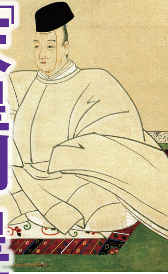
「光格天皇像」 (東京大学史料 編纂所蔵・模本)