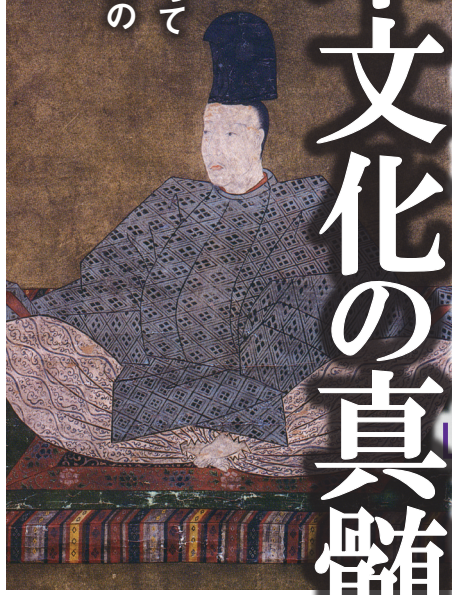
「伝後花園天皇像」(京都・大應寺蔵)

戦後レジーム脱却を 訴えるならばGHQによって 皇籍離脱させられた宮家の 皇籍復帰を実現すべき。